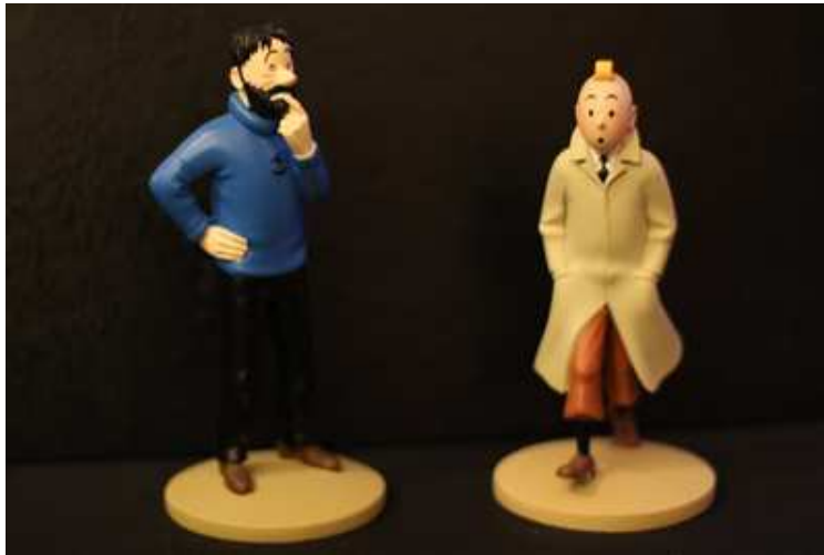
Image BW auto

Le but de ce traitement est de régler la balance des blancs avec son appareil photo avant de prendre une image sous des conditions de lumière particulières.