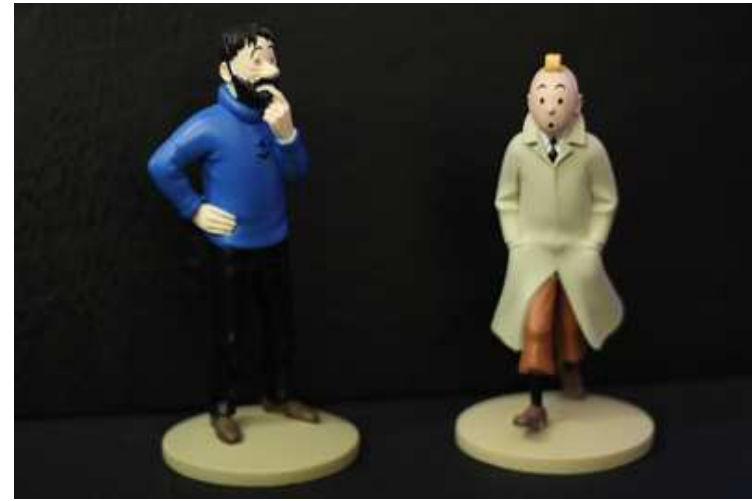
Image BW personnalisée